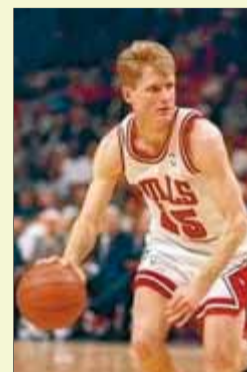
Kerr en la seva etapa de jugador dels Bulls ■