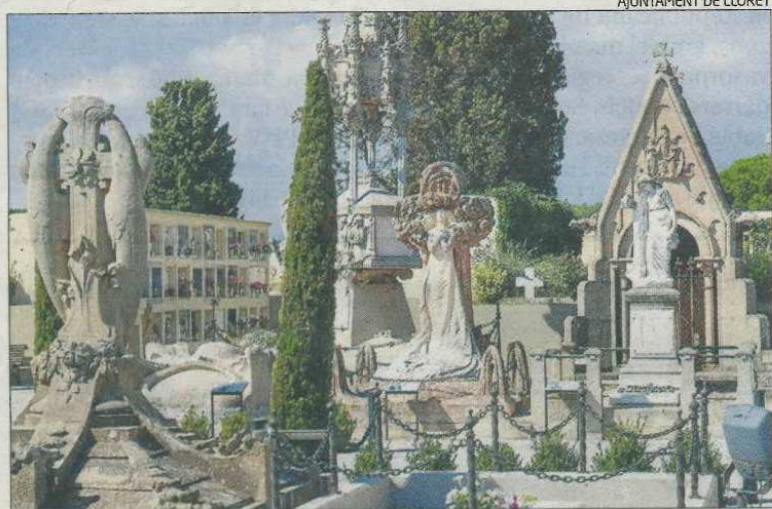
Una imatge d'arxiu del cementiri modernista de Lloret de Mar.