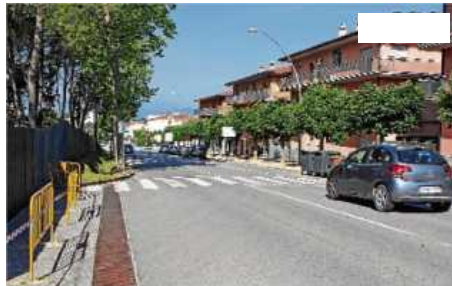
El projecte preveu la construcció d'una rotonda a la font del Cantí.

CALDES DE MALAVELLA | D. JIMÉNEZ El ple de l'Ajuntament de Caldes de Malavella va aprovar el passat 31 de març el projecte d'urbanització d'un tram de la carretera de Llagostera. En concret, es tracta d'una part que conforma la principal via que travessa el municipi. El projecte es troba en fase d'exposició pública i, un cop esgotats els 30 dies, es donarà audiència als veïns, licitaran el projecte, adjudicaran i executaran les obres.