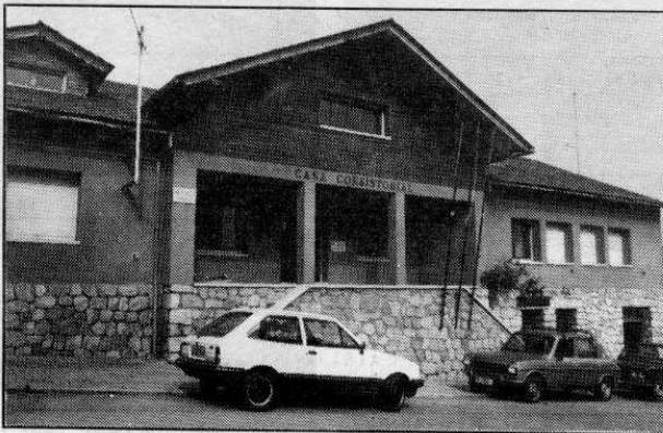
L'Ajuntament d'Alp va acollir una part dels 700 'hostes' forçosos

Puigcerdà i Alp van convertir-se, de forma inesperada, en les poblacions on van pernoctar uns dos mil forasters que tornaven a casa després d'un llarg cap de setmana, els uns, o que havien aprofitat la festivitat de la Puríssima per estrenar la temporada d'esquí, els altres. El cert és que a Alp, l'ajuntament, el Casino, el teatre i altres edificis públics van convertir-se en allotjament d'emergència per a aquests hostes inesperats. A Puigcerdà, per la seva banda, també les autoritats locals van haver de prendre mesures d'emergència, amb el suport de Protecció Civil, per encabir el miler de persones que es va veure atrapat a la capital de la Cerdanya. L'edifici de l'ajuntament, col·legis, el gimnàs i altres locals municipals van fer possible que aquestes persones passessin la nit sota cobert. El gruix dels participants en aquest retorn massiu va apro-