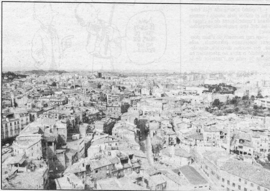
La Cambra de la Propietat de Manresa demana als propietaris que s'informin abans de recórrer