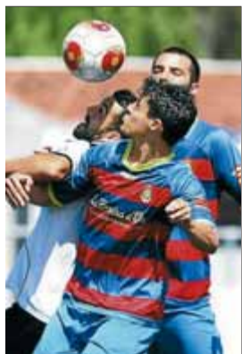
Fullana, en acció

L'empat provoca que el duel de la setmana que ve al camp del Llevant B (dissabte a les 6) sigui