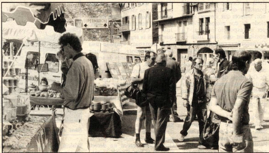
La diada de la Cerdanya va aplegar la majoria dels ajuntaments d'aquesta comarca

La trobada d'alcaldes ceretans va ser un dels actes de la diada de la Cerdanya, celebrada a Font-romeu, i que va començar a primera hora del matí amb la signatura en un pergamí recordatiu. Una còpia d'aquest document serà enviada a cadascun dels ajuntaments assistents a la diada. En total, hi havia, per la part catalana de la Cerdanya, Fontanals, Bolvir, Puigcerdà, Alp, Das, Urús, Prullans, Llivia i Guils. Els