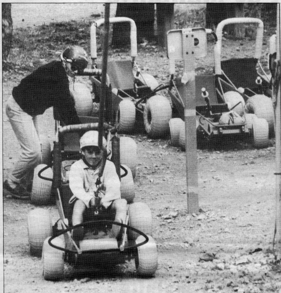
Els karts de muntanya que funcionen a l'estiu a la Molina i les aigües termals de Dorras.