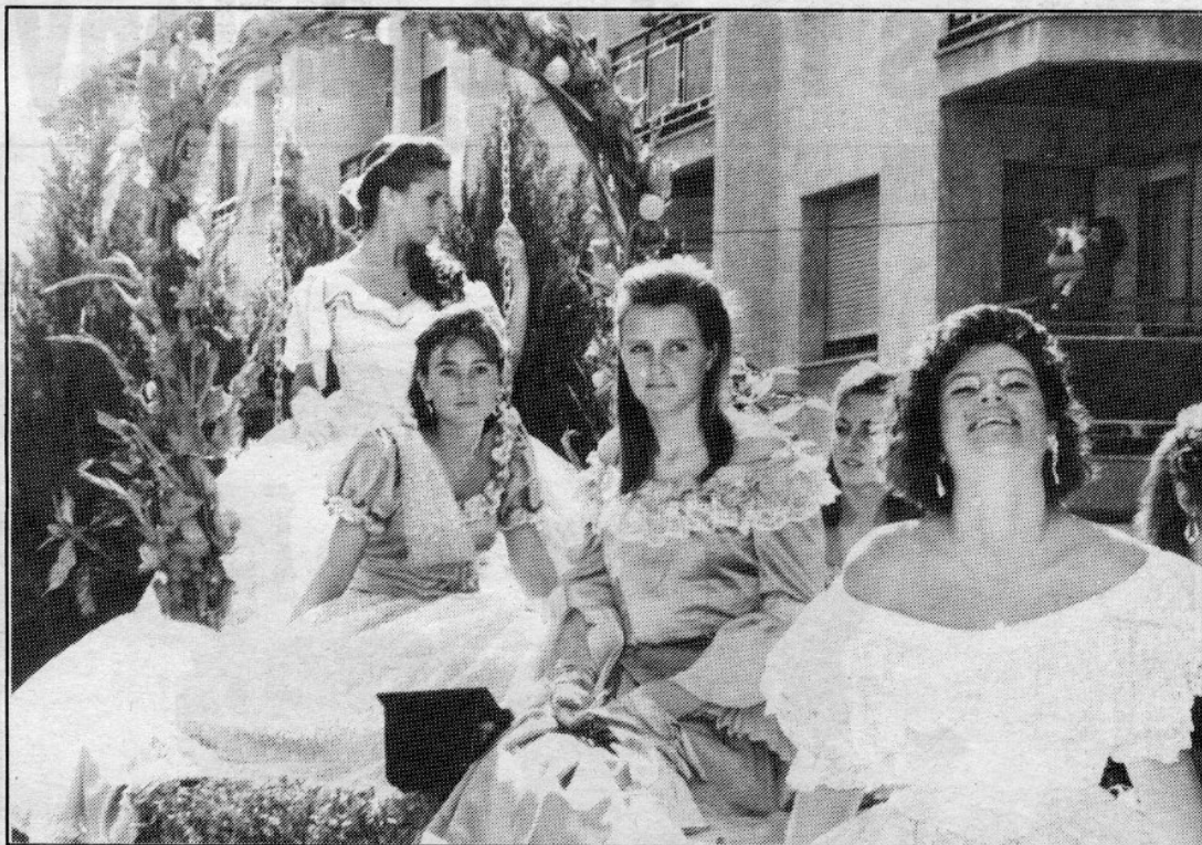
Les carrosses es fan mestresses dels carrers de Puigcerdà durant la celebració de la Festa de l'Estany