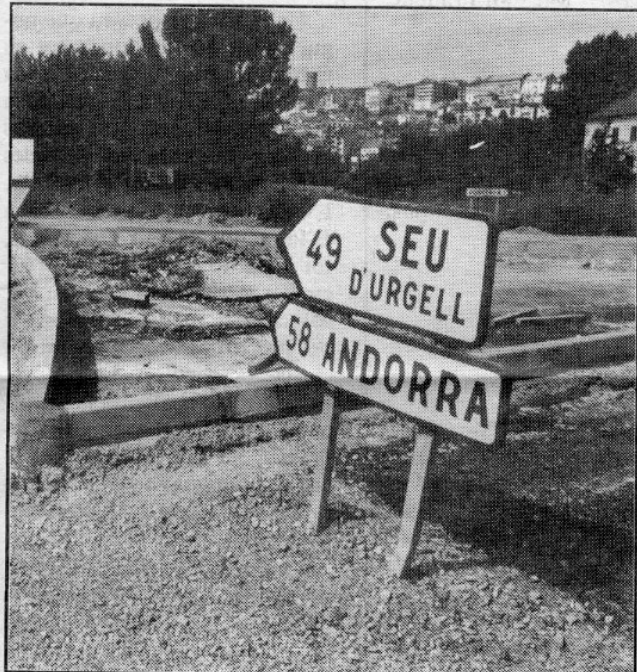
Amb aquestes obres s'acaba una remodelació desitjada des de fa anys

Tot i que aquests dies els treballs obliguen a fer retencions en el trànsit d'entrada i sortida de Puigcerdà, amb les consegüents molèsties per als usuaris, aquestes obres eren molt esperades per solucionar un dels punts conflictius en la xarxa viària de la Cerdanya.