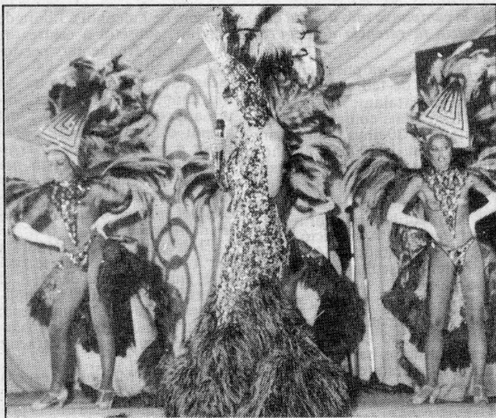
La Maña va presentar un espectacle amb molt d'èxit

L'envelat va acollir les activitats més participades