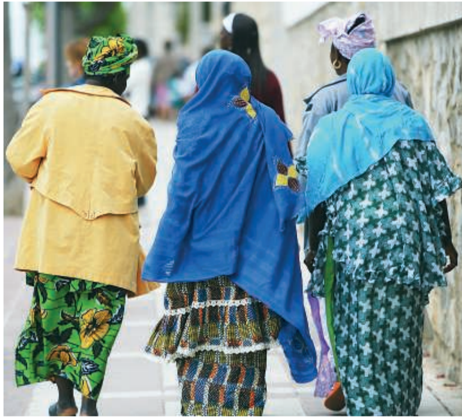
La immigració és un dels objectius de la incorrecció política.

Però em temo que no sempre és fàcil distingir les seves càrregues de les càrregues dels que, de fet, són reconsagradament carques. No sé si m'explico. Vull dir que, per exemple, als que els fa tanta gràcia l'esforç de qui recorre als circumloquis per evitar el mot negre en les seves disputes, obliden que lluny de tanta sofisticació i tan alta esgrima, a les aules, a les bastides, a les empreses, hi ha molt mala bava. I que a aquests indrets, sovint, quan es crida negre es crida amb totes les lletres i totes les intencions. I vull dir també que, quan totes les polítiques de discriminació positiva es comencen a percebre com a injustes o com a estúpides és perquè tu i les teves circumstàncies queden lluny de les contínues discriminacions negatives que genera la nostra societat. Predomina