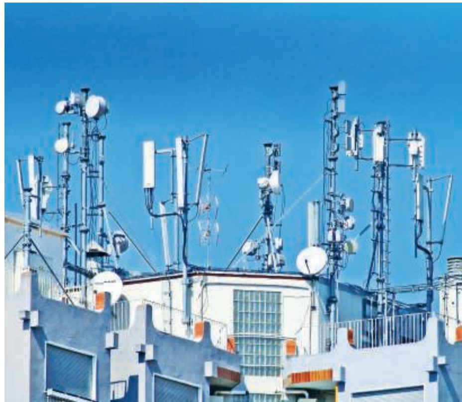
Antenes de telefonia mòbil al terrat d'un edifici de Girona.

No sé si vostès han participat mai en un dels debats que emergeixen, s'enfilen i esclaten als barris, poblacions o comunitats de veïns on s'ha d'avaluar una de les temptadores ofertes de les companyies telefòniques per aconseguir els nostres cims. Si ho han fet ja saben de quins apassionaments els parlo, i de quins xocs. A vegades semblen combats entre ciències i lletres o entre entusiastes de la tecnologia i entusiastes de les postes de sol, o entre aprensius i frívols, però malgrat tot, sospi-