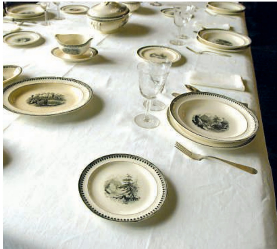
Una taula parada per a un àpat de festa.

El discurs nadalenc és clar. Que la pau i l'harmonia s'estenguin damunt totes les