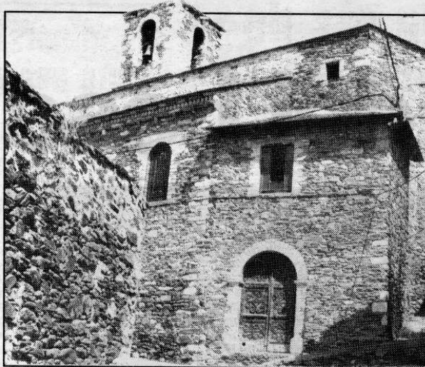
L'església de Ger serà el primer lloc que rebrà el bisbe d'Urgell en la seva visita a la Cerdanya