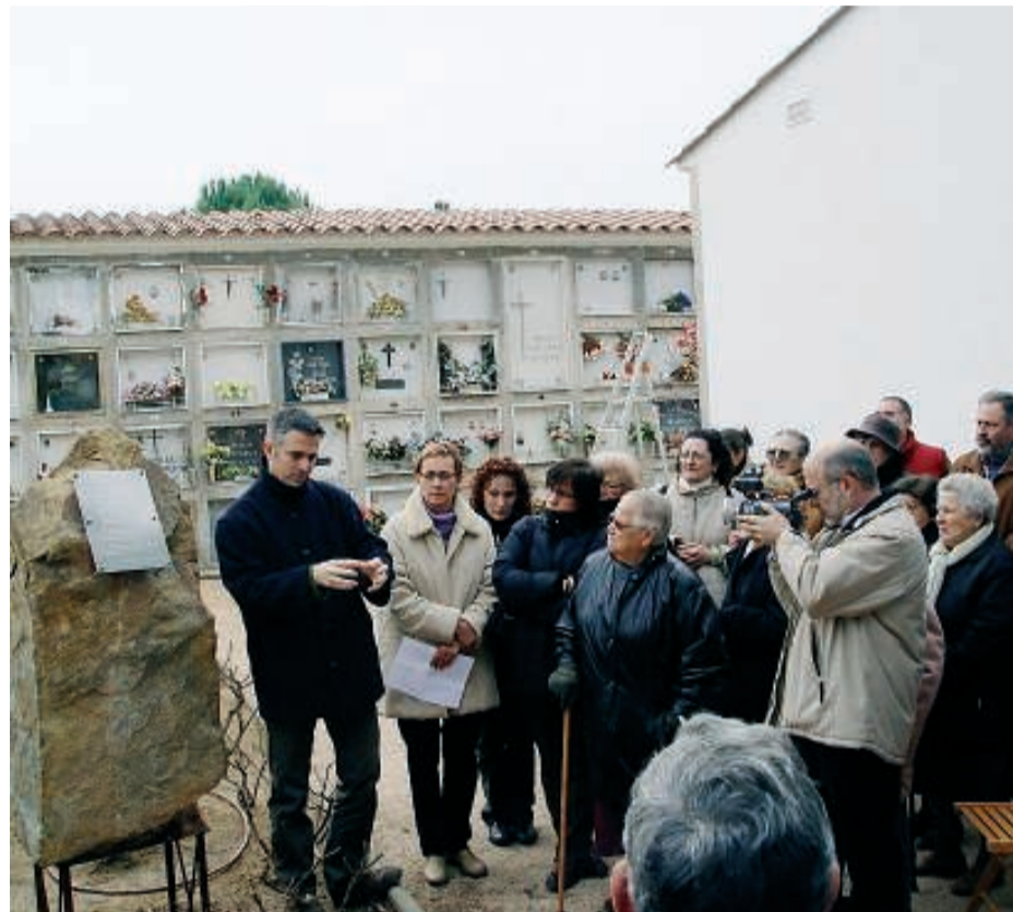
Monòlit d'homenatge als represaliats pel franquisme al cementiri de Llagostera.

Els accessos d'odi sempre impressionen i la carta, segueix explicant-me, en contenia molt. S'havia activat el ressort, la dotzena de frases pulcres però contundents de la rèplica que va adreçar al diari havien trencat la crosta finíssima que ens protegeix d'aquestes forces que es perden en el fons de la nostra història. I probablement, deia, un vellet venerable, un avi afectuós amb les nétes i considerat amb