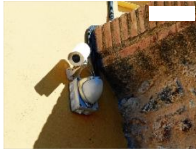
La càmera de videovigilància que controla l'accés a les Termes. carles colomer

CALDES DE MALAVELLA | D.J. L'Ajuntament de Caldes de Malavella va anunciar cap a l'estiu de 2011, després d'uns incidents a les Termes Romanes, que tenia la intenció de col·locar diferents càmeres de videovigilància en els equipaments del municipi i així poder controlar que no es produïssin problemes. Des de llavors, el consistori ha anat fent la feina i se n'han instal·lat les primeres. En aquell moment l'alcalde, Salvador Balliu, va explicar que Renfe n'havia instal·lat a l'aparcament de l'estació, on s'havia produït algun problema. I l'Ajuntament, entre setembre i octubre de 2013, també en va decidir posar a la comissaria de la policia local, tant a l'interior com a fora i a l'aparcament.