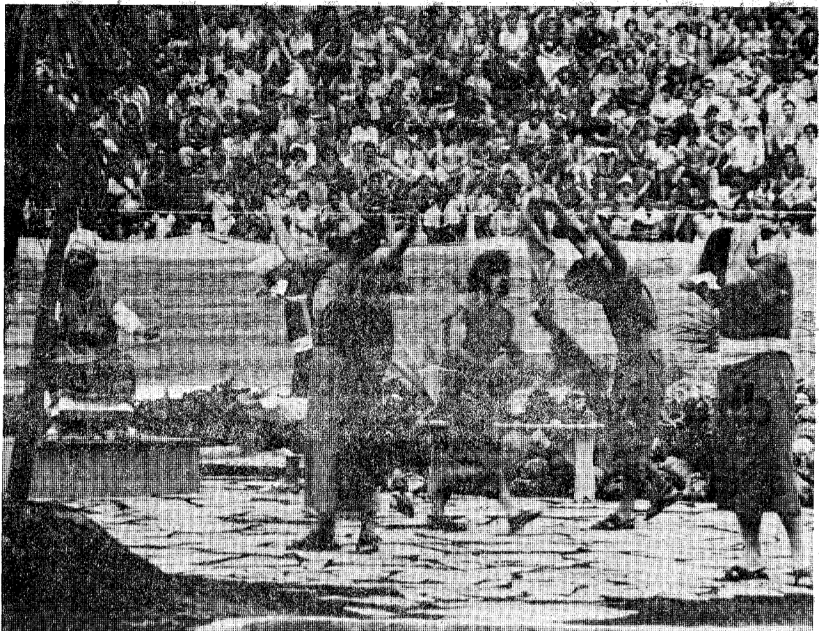
Los dramas bíblicos son muy apreciados por los Asambleístas.

(Viene de la página anterior) con motivo de esta Asamblea Internacional «Fe victoriosa», tuvieron ocasión de verse nuevamente. Había los que preferían estar sentados a la «sombra» aunque no había muchos lugares que dispusieran de ella. Se habían improvisado grandes mostradores donde se servían bocadillos calientes, refrescos, pasteles, helados y una extensa gama de bocadillos.