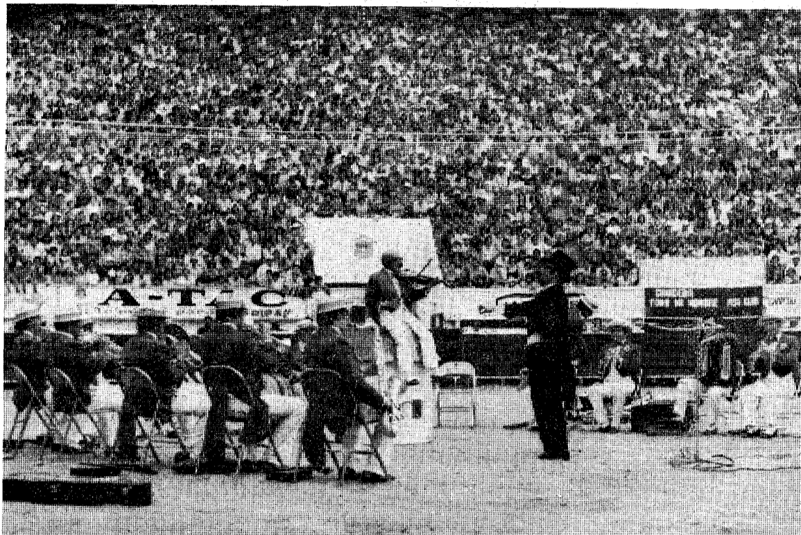
La mundialmente famosa banda de «El Empastre», que actuó el miércoles anterior, en el coso guixolense.

El parte médico facilitado en la enfermería por el doctor Olsina después de la operación