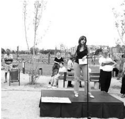
► La primera inauguració de Pineda. L'obertura del parc del Rec Monar de Salt, ahir, ha estat la primera inauguració de l'alcalde de Salt, Iolanda Pineda, des que ha accedit al càrrec. A l'acte, hi van assistir regidors d'aquest i d'anteriors governs que hi van ser convidats, juntament amb l'arquitecta del projecte, Laia Escrivà. Situat entre el nucli i les deveses, el parc té més de 35.000 m 2 . / M.B./M.R.