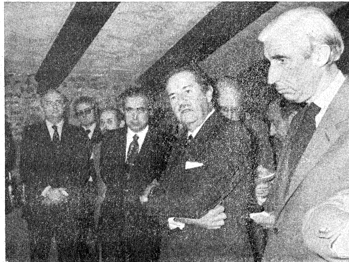
He aquí, en fotografía de archivo, un momento de la reunión que finalizó con el denominado Pacto de Hostalrich.

Analizó luego el señor Martínez Esteruelas los diversos aspectos del programa de Alianza Popular, y consideró que las