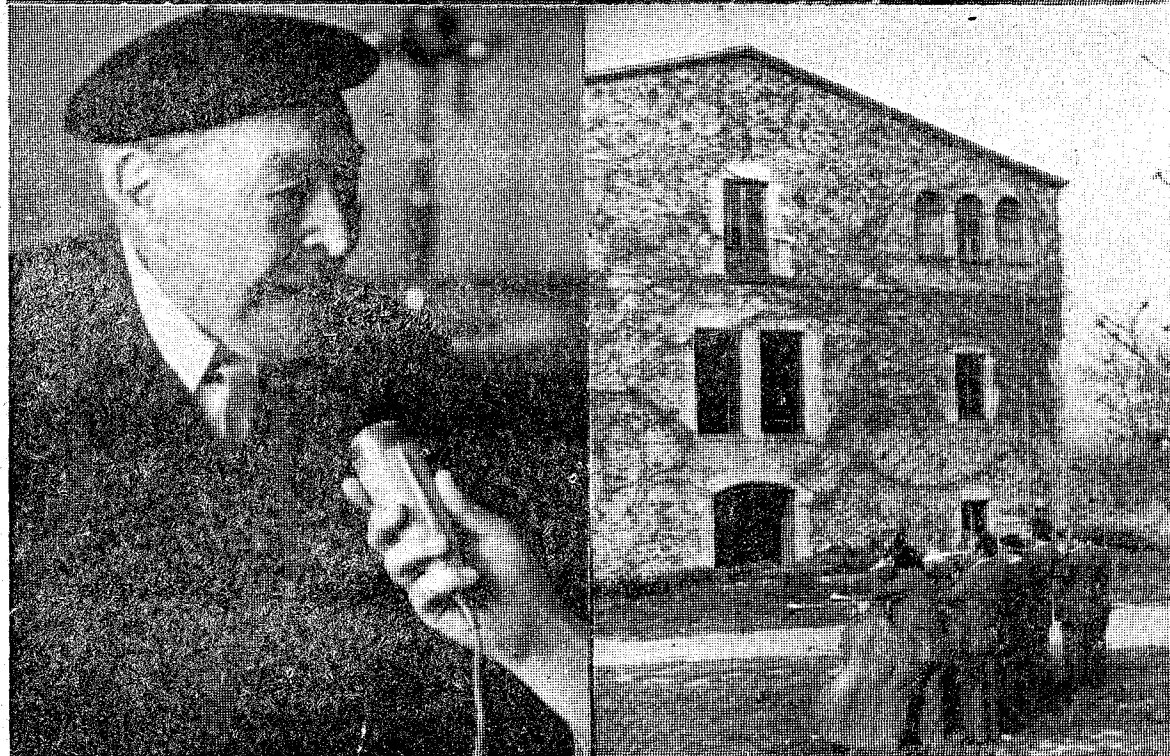
Publicamos hoy estos documentos gráficos de Xavier Amir sobre el homenaje tributado a Josep Pla con motivo de cumplirse el octogésimo aniversario del nacimiento del patriarca de las Letras catalanas. Pla, felicitado por sus amigos; respondiendo a Armengol para TVE, y la cobla «Costa Brava» ante el Mas Pla, de Llofriu, la tarde de la pequeña fiesta.