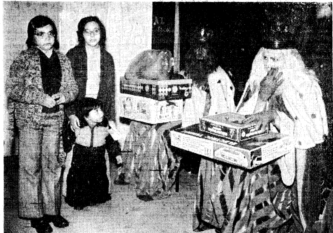
Un centenar de hijos de productores de la empresa Butano, S. A. de Caldas de Malavella, han sido agasajados con diversos regalos y obsequios con motivo de la pasada festividad de los Reyes Magos. Todos ellos recibieron sendos lotes de juguetes y golosinas en las dependencias de la propia empresa, al tiempo de disfrutar de un festival que hizo las delicias de todos los presentes, y que estuvo a cargo de los mismos productores y sus hijos.