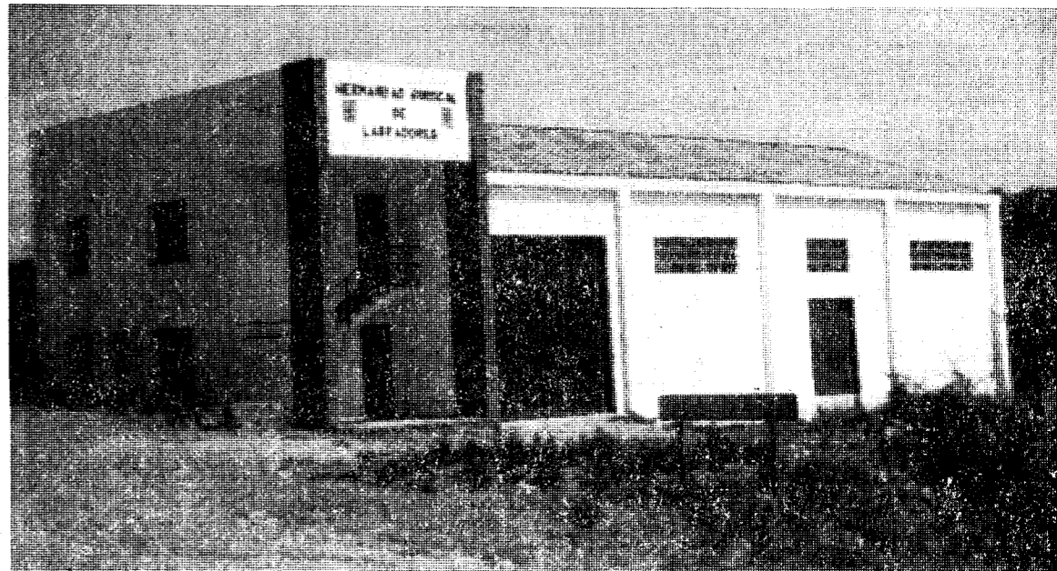
En la fotografía, la sede de la Hermandad Sindical Local de Labradores y Ganaderos de Garrigolas.