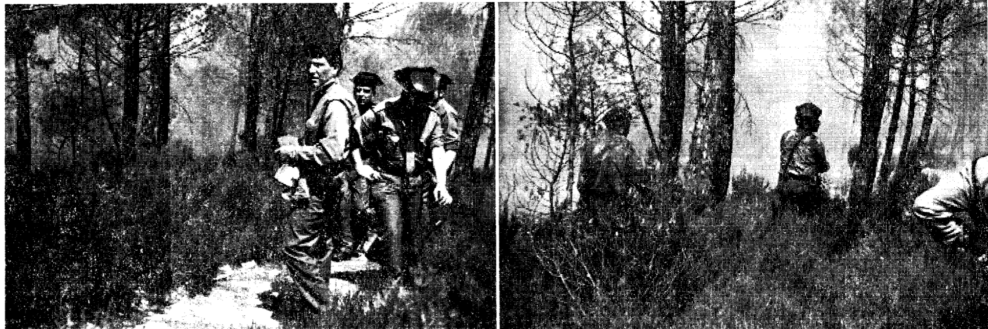
El domingo, hacia las tres de la tarde, se declaró un incendio en el término municipal de Caldas de Malavella. Al parecer, el fuego se inició junto a la carretera Nacional II, en el desvío de la carretera de Caldas. La fuerza del viento propagó rápidamente las llamas, que destruyeron unas treinta hectáreas, aproximadamente. Fuerzas de la Guardia Civil de Caldas, bomberos de la Diputación de Barcelona y

30 hectáreas de pinar devastadas por el fuego, en Caldas de Malavella