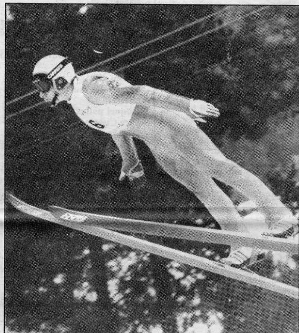
Els austríacs no donaren opció