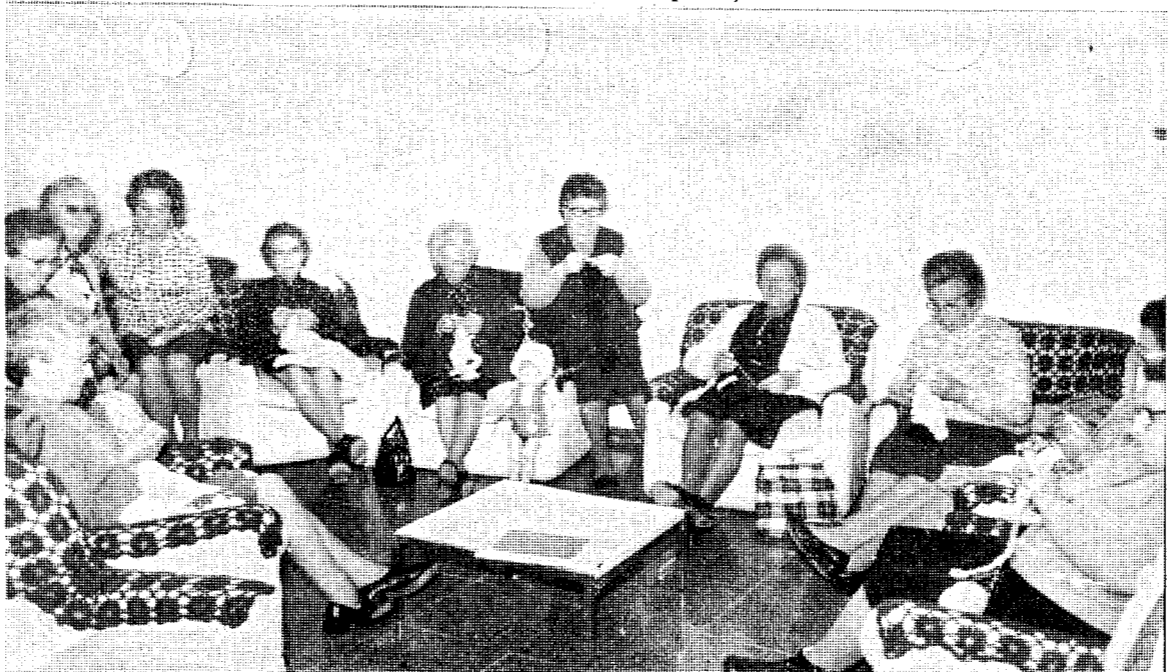
Un grupo de señoras departe amigablemente, mientras se entretienen en labores de punto.