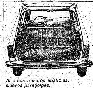
Asientos traseros abatibles. Nuevos paragolpes.

cambiables. Potencia DIN 44 CV a 5.900 r.p.m. Par máximo DIN 6,7 kg. m. a 3.500 r.p.m. Batería 12 V. 4 velocidades sincronizadas. Velocidad 130 km/h. Consumo 6,5 l. cada 100 km. a una velocidad de 80 km. de media, en terreno me-