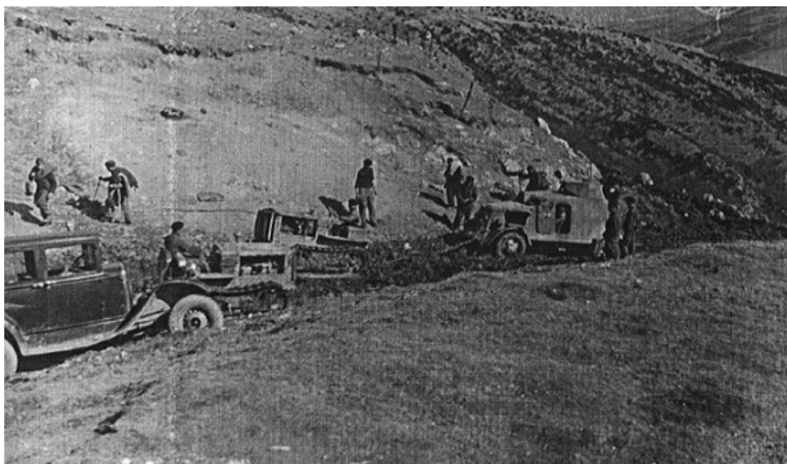
Cotxes i material militar abandonat a coll d'Ares.

Cal dir, però, que la feina no fou endebades, ja que segons la mateixa font, «A coll d'Ares 12 autometralladores han aconseguit posar-se en marxa cap al nostre territori pel traçat que havia estat construït pels espanyols i interromput per ordre de les autoritats franceses. Aquests vehicles han estat immediatament recuperats per l'exèrcit francès».