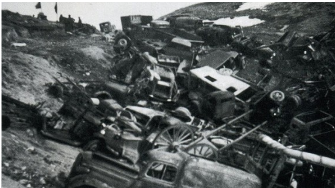
Cotxes i material militar abandonat a coll d'Ares.

Entre mitjans de gener i el 13 de febrer de 1939 una quarta part dels exiliats republicans van creuar la frontera en condicions lamentables pel pas que separa Molló i Prats de Molló