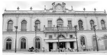
Al Casino Llagosterenc s'hi fan balls de saló.

portiva: «El que importa és participar.» I és que de participació no n'hi falta mai, i cal destacar que en aquests dos últims anys s'ha ultrapassat els 800 corredors, provinents de moltes poblacions de la zona.