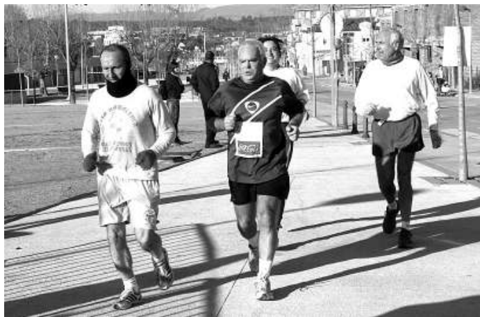
Un moment de la cursa de Sant Esteve de l'any passat.

Com cada edició, la sortida serà a les 10 del matí al davant del pavelló municipal d'esports, encara que els participants s'hi hauran d'haver inscrit entre les 8 i 2/4 de 10 del matí del mateix dia 26 de desembre i haver pagat els 7 euros que