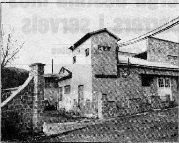
La química de Martinet desapareixerà del paisatge urbà

Serien per a estlueig dels treballadors de Barcelona