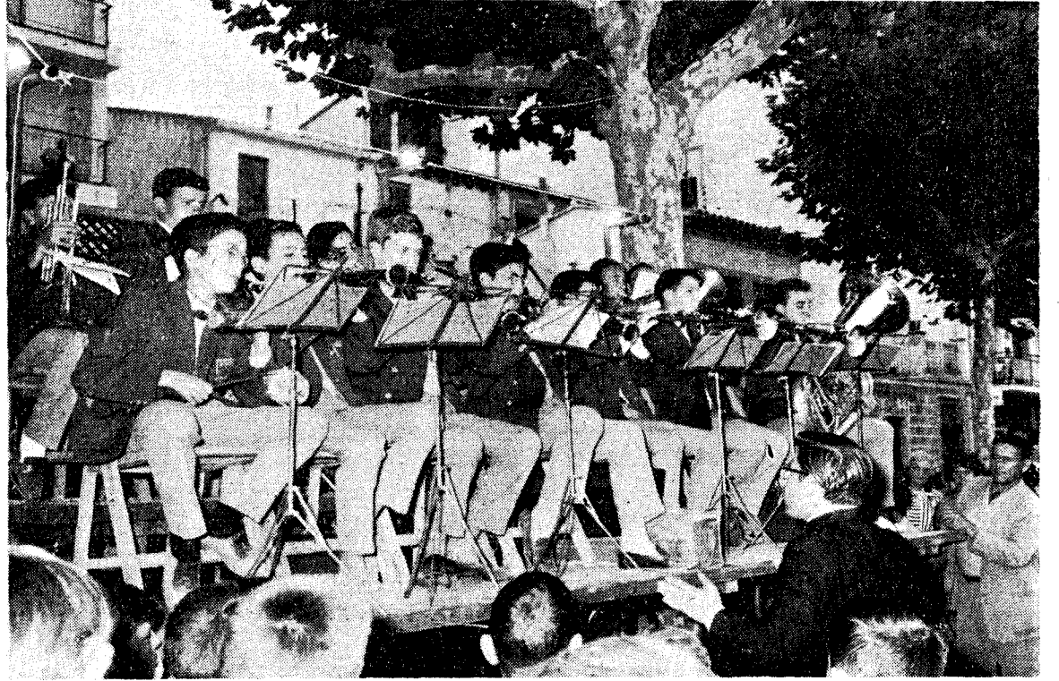
Formación inicial de la cobla infantil, en 1967.

Esta presentación resultó un verdadero acontecimiento en la villa y pronto fue despertándose la afición entre la juventud blandense, haciendo que actualmente sean tres las coblas existentes bajo esta misma denominación. La renovación ha sido constante y si bien alguno de estos jóvenes que se integraron en la primera cobla o en alguna de las posteriores ha causado baja, otros han venido supliendo aque-