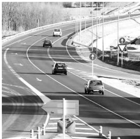
La variant de Llagostera, en una imatge d'arxiu.

Pels mateixos motius tampoc no s'allargarà l'eix transversal fins a Llagostera i la Costa Brava centre, com han demanat les cambres de comerç.