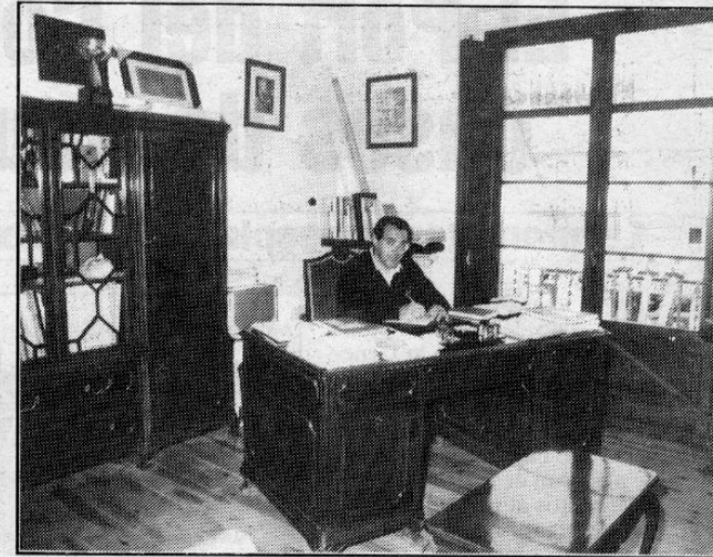
Llombart aposta pel futur turístic de la comarca

A la mateixa comarca, el Patronat de Turisme també aporta el seu gra de sorra per a la promoció de la Cerdanya.