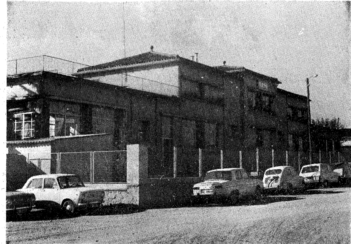
Vista frontal del Colegio Nacional Comarcal.

gratuitas, corriendo a cargo del Estado el pago del profesorado. Es una gran ocasión para todas aquellas personas con afán de superación y cultura, no importan-