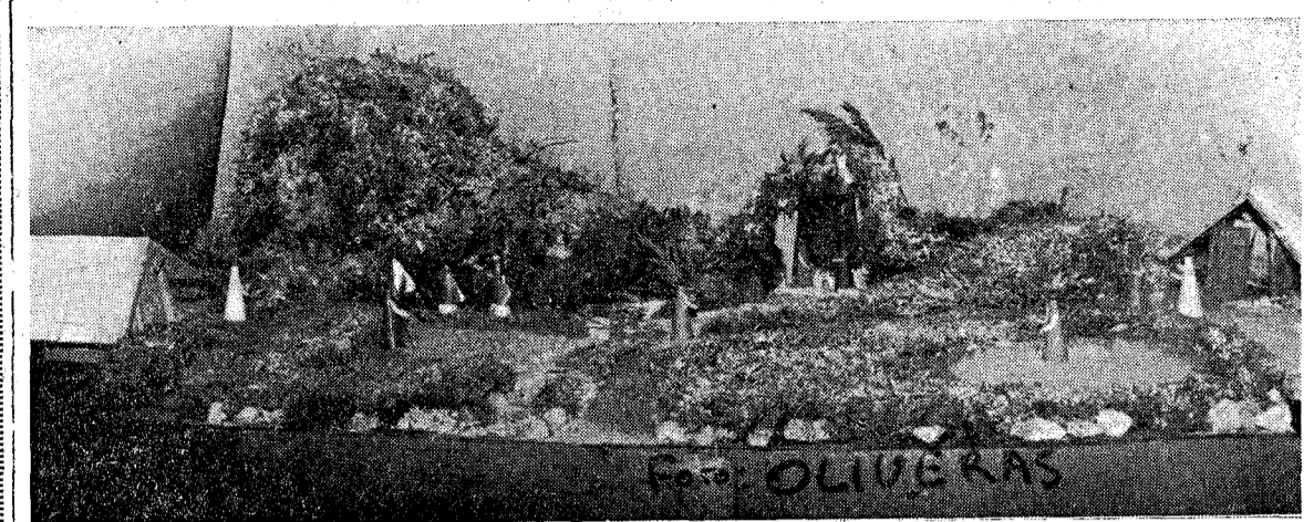
El pesebre ganador del concurso, totalmente confeccionado por los «XEROQUIS».

Como en días anteriores habíamos anunciado en nuestro diario, durante las Fiestas de Navidad de 1971 se celebró en Caldas de Malavella un concurso de "Pesebres" organizado por la Caja de Pensiones para la Vejez y de Ahorros y el Casal Catequístico Escolar.