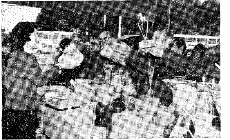
Una de las ganadoras de la pasada edición recibiendo los trofeos y premios conquistados.

Ha sido concedida la fecha de la celebración del ya famoso Cross Regional de Caldas, por parte de la Federación Provincial de Atletismo de Gerona. Dicha fecha es la del día 30 de enero de 1972. Se comunica también que este tercer Cross estará bajo el control de la