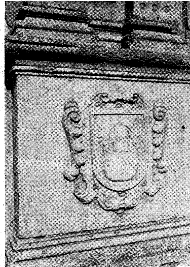
Escudo que figura en el pórtico de la iglesia.

vetulo...» (390 L. F.) y precisamente a poniente de Caldas están los montes de San Mauricio.