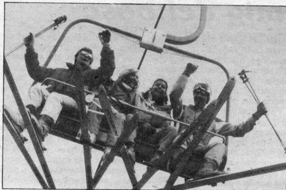
Per un petit suplement econòmic, els esquiadors podran gaudir de les dues estacions ahora.

L'acord entre les dues estacions permetrà diverses modalitats d'accés al domini esquiabls. Per una banda, s'ha creat un «forfait» conjunt per un o dos dies que, per un preu realment moderat (2.000 ptes. els dies feiners i 2.400 els festius), donarà accés a les dues estacions. Una altra modalitat, especialment concebuda per als esquiadors de setmana (forfait de 5 o més dies) dona la possibilitat d'unió per un import suplementari de 300 ptes. diàries.