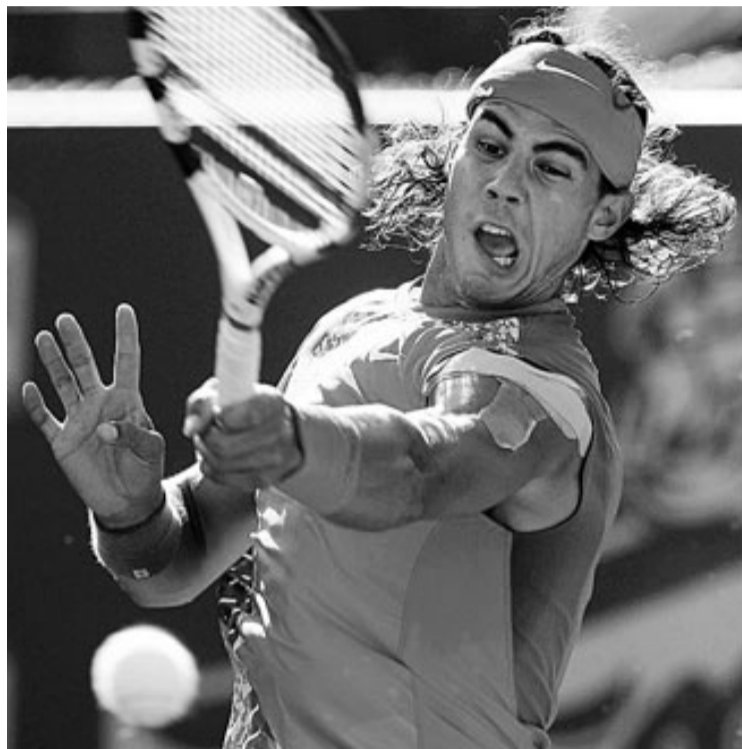
Nadal colpeja amb força durant el matx contra Feli López.

Per contra, Nadal, que acostuma a treure transcendència a les grans xifres, va limitar-se a comentar que simplement estava jugant bé. I Feli López, 35è del rànquing ATP, ho va poder comprovar. Durant el primer set va plantejar un joc directe (servir fort, pujar a la xarxa, ariscar amb cops profunds...) per evitar un intercanvi de cops clarament favorable a Nadal. Una estratègia valenta, que li va servir per mantenir l'equilibri en la primera mànega però que no li va permetre trencar el ser-