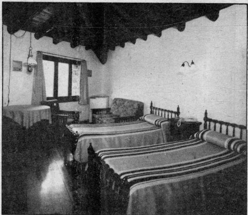
Una àmplia habitació de can Borrell, amb nevera, música estéreo, taula per escriure, sofàs per conversar i, per suposat, una magnífica vista al Pirineu.