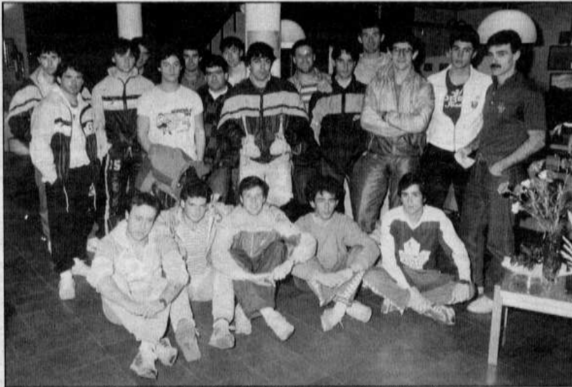
Alguns membres de la selecció espanyola, a l'hotel de Puigcerdà on s'han instal·lat durant aquesta setmana prèvia de preparació.

de diners. Una preparació llarga val diners i si no n'hi ha no es pot fer. Per altra banda els jugadors són aficionats, és a dir tots tenen el seu treball de cada dia i la majoria no el pot deixar fàcilment durant un mes per preparar-se en la selecció.