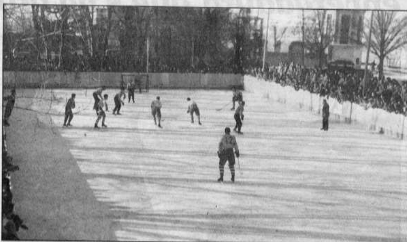
La imatge correspon al festival de gel del 1958. L'assistència de públic era notable i s'ha mantingut al llarg de tots aquests anys.

L'any 1957 es realitzà el primer partit organitzat seriosament. Serví de pista el mateix llac i per comprovar la seva resistència al pes humà, abans de començar passejaren un carro carregat de rocs pel lloc on havia de disputarse el matx. Com que el gel resistí sense cap queixa, poc després, els nois de Puigcerdà que remenaven millor l'estic i el patí de gel, s'enfrontaren a l'equip Pi Núria, que ja portava