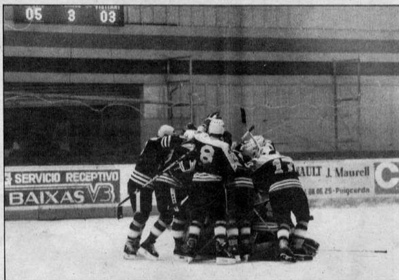
El Club Polisportiu ha gastat 35 milions per deixar el pavelló en condicions aptes per a un mundial

Nosaltres som, en darrera instància, els responsables de l'organització d'aquest campionat. Nosaltres, conjuntament amb el Club Polisportiu, amb qui vivim junts encara que no estiguem casats. M'explicaré; si bé tant el Club de Gel com el Polisportiu són dues entitats diferents que funcionen amb pressupostos independents i disposen cada una de la seva pròpia junta directiva, l'esperit que ens anima és el mateix i a l'hora de treballar sempre ho hem fet conjuntament.