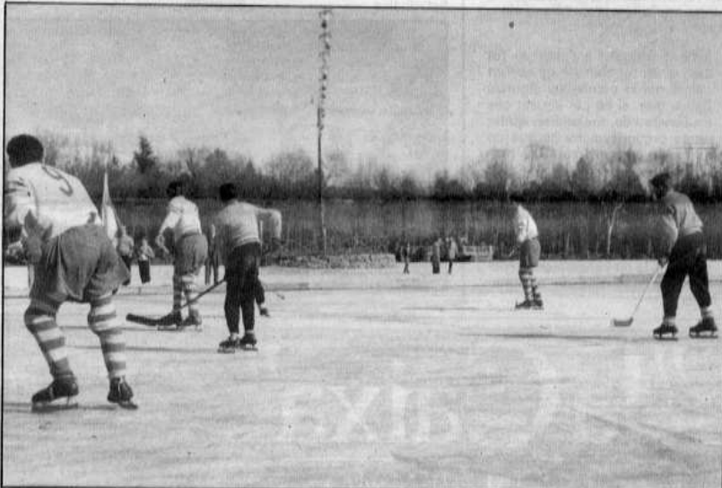
Els del Pi de Núria anaven força ben equipats. Contra ells es jugà el primer partit d'aquesta especialitat.