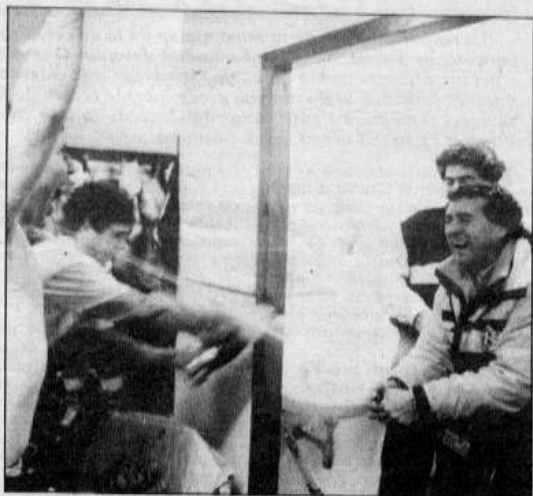
Aquest ha estat un any d'èxits per al Club Gel Puigcerdà.