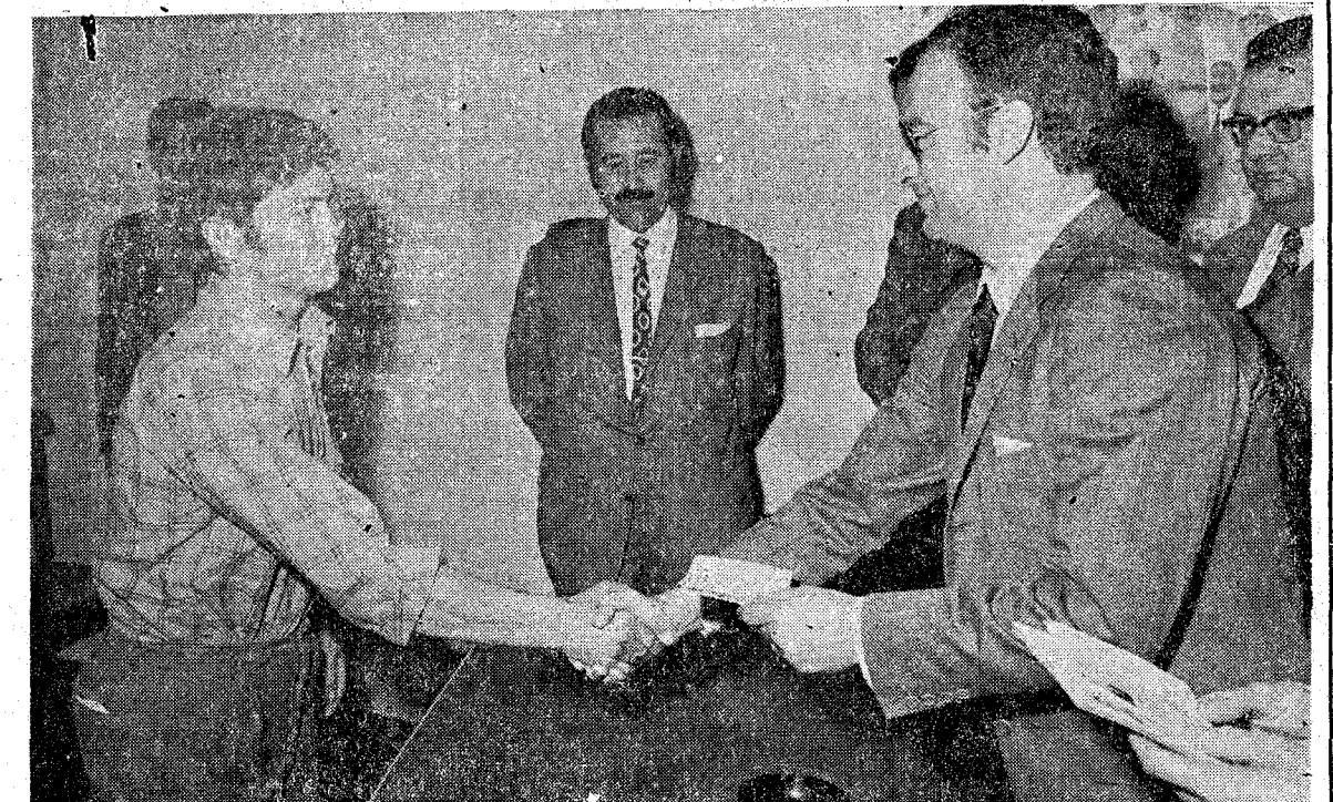
El Gobernador Civil, durante la entrega de los títulos a los cursillistas. — (Foto Sans).

el espíritu de colaboración existente entre los distintos Departamentos ministeriales, que hoy han coordinado sus esfuerzos para que esta realidad haya tenido lugar: "En este sentido de colaboración —dijo el señor Anguera—, es significativo que un principio de humanismo social, de formación profesional y humana, dé también aliento a las máquinas y al cemento de las grandes obras públicas". Posteriormente, se hizo entrega de los títulos profesionales obtenidos, y el Gobernador y las restantes autoridades asistentes departaron con los alumnos sobre los conocimientos adquiridos.