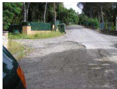
deteriorada. Les instal·lacions i l'asfaltatge s'han deteriorat amb els anys, i moltes cases no tenen llicència. ddeg