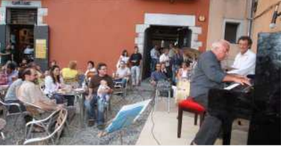
Cafè de l'Arc Un dels cafès històrics de Girona.