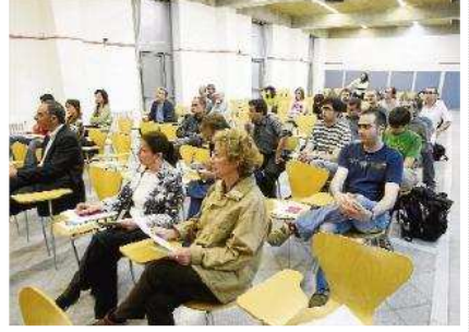
nou informe. Ahir es van donar a conèixer els resultats de l'Informe de Sostenibilitat Municipal. marc marti

DdeG, Girona. El consum d'energia d'origen domèstic va augmentar un 39% entre els anys 2000 i 2006 a les comarques gironines, la qual cosa significa que cada habitant de la demarcació va incrementar en un 15% la seva despesa en electricitat. Així doncs, l'augment de la despesa energètica ha estat molt superior a l'increment de població experimentat. En aquest sentit, destaquen especialment els casos de Celrà, on el consum d'electricitat per habitant ha crescut un 70%, i Vidreres, on s'ha registrat un descens del 30%. Tot i això, només la comarca del Ripollès compta amb una producció d'electricitat estrictament a través de fons renovables que sigui realment important (80%). A la resta de la demarcació, la producció amb fonts renovables sol anar acompanyada d'altres tècniques com la cogeneració o els grups electrògens.