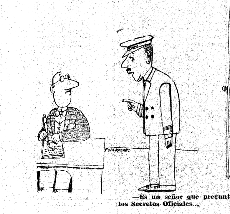
—Es un señor que pregunta si es aquí donde se archivan los Secretos Oficiales...