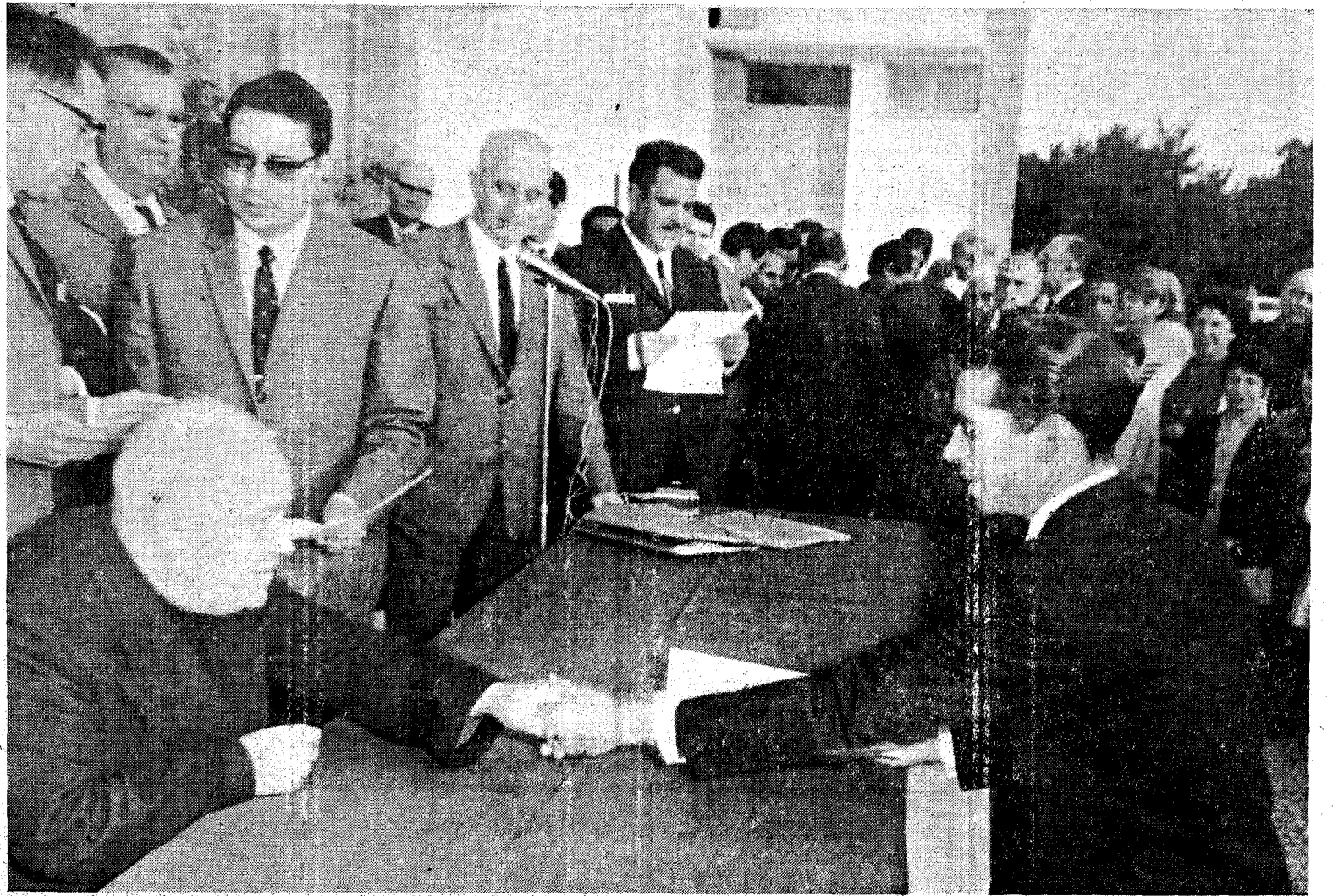
Momento de la entrega de los contratos a los productores que han de ocupar las nuevas viviendas.