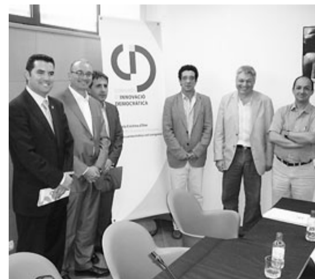
Els organitzadors del congrés, ahir a Santa Cristina. / J.T.

ció del congrés és una iniciativa conjunta de l'Ajuntament de Santa Cristina d'Aro, el Consell Comarcal del Baix Empordà, la Diputació de Girona, la Diputació de Barcelona, la Universitat de Barcelona, la Universitat de Vic, i el Departament d'Interior, Relacions Institucionals i Participació Ciutadana de la Generalitat de Catalunya.