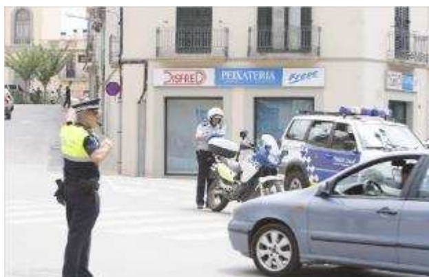
Agents de la Policia Local de Llagostera regulant el trànsit del municipi. marc mart

"Aquesta Policia Local dedica menys temps a les funcions repressives que a altres funcions policials; encara