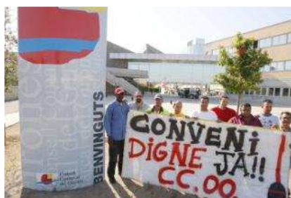
Els treballadors de l'empresa Sufi es van concentrar ahir al matí davant el Consell Comarcal del Gironès. marc martí

El que sí que és cert és que la ciutadania ha fet cas dels bans emesos pels ajuntaments. Ahir al matí, a poblacions com Llagostera, Cassà de la Selva o Quart, la majoria dels contenidors de recollida selectiva no tenien deixalles escampades pel voltant.