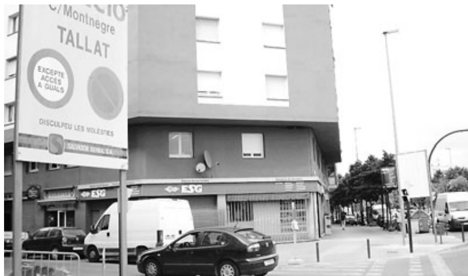
Dos cartells anuncien les obres de reurbanització del carrer Montnegre de Girona.

bert del Pla. Les obres han obligat a treure tot l'aparcament del carrer Orient, des de tocar de l'escola Dalmau Carles fins al carrer Campcardós. La construcció d'un carril bici al passeig d'Olot ha suposat la supressió de pàrquings en aquest carrer. El carril bici que s'està fent anirà des del carril bici de Salt fins a la frontissa del Güell, on enllaçarà amb el carril bici existent.