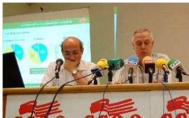
CCOO proposa aprofitar les línies de tren per anar a treballar als polígons industrials

GIRONA | MARINA LÓPEZ/ACN/DDG CCOO va defensar ahir com a aposta de futur la creació del tram-tren, una xarxa que funcioni com a tramvia als nuclis urbans i com a tren en els espais lliures. La línia connectaria el litoral amb la ciutat de Girona, per després avançar cap a Llagostera, Cassà de la Selva i l'aeroport; així com també cap a la Bisbal passant per Celrà i Flaçà. La seva proposta es completa aprofitant les línies de Renfe properes a polígons industrials de Riudellots, Fornells, Perelló, Mas Xirgu i Celrà per facilitar el desplaçament dels treballadors.