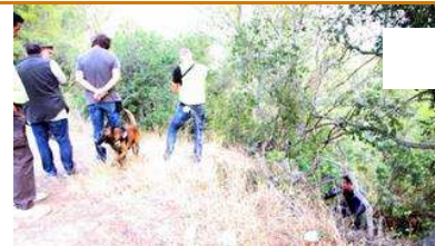
Toben restes humanes a Begur