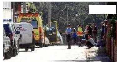
El crim es va produir a la urbanització del Llac del Cigne de Caldes.