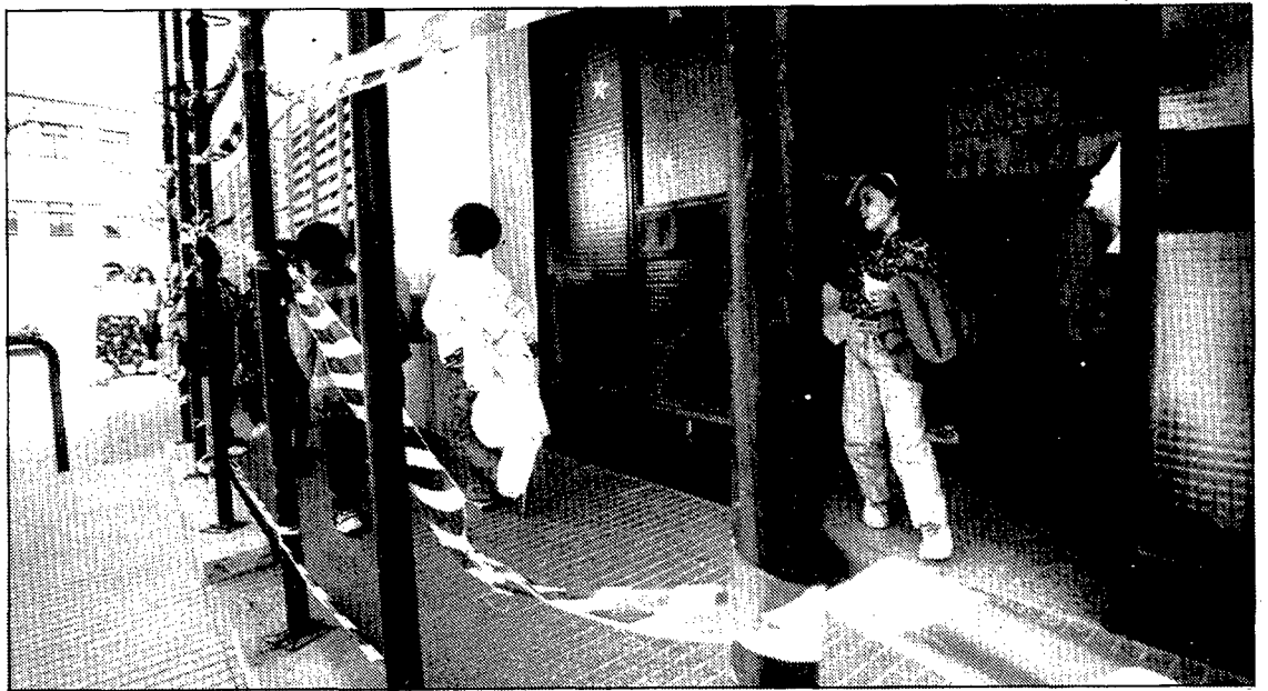
Uns nens, sortint ahir al migdia de l'escola Sant Esteve de Caldes de Malavella, on s'hi ha detectat ciment aluminós.

de 10.000 metres quadrats per si es vol fer una escola nova. L'Escola Sant Esteve es va construir a finals dels anys 50 i acull actualment 286 alumnes.